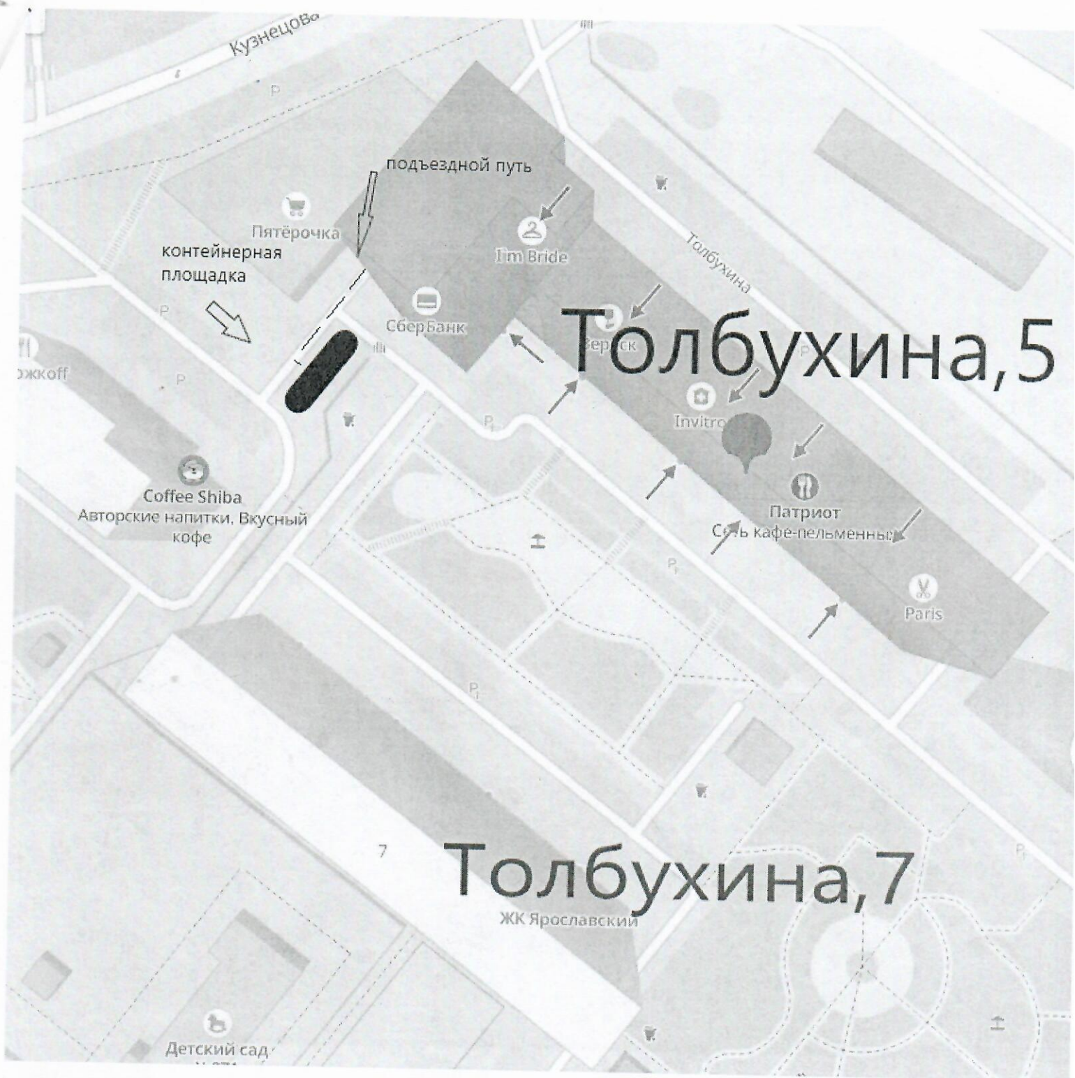
ПРИЛОЖЕНИЕ № 1. Место для создания контейнерной площадки (схема)